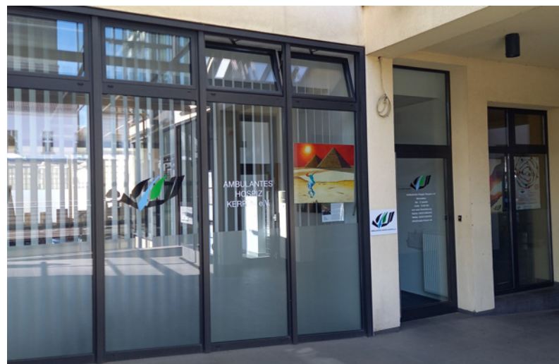
Unsere Räume in Kerpen, Stiftsplatz 14-16